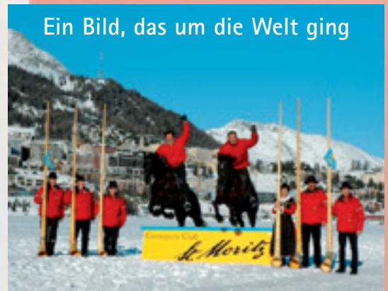
Ein Bild, das um die Welt ging