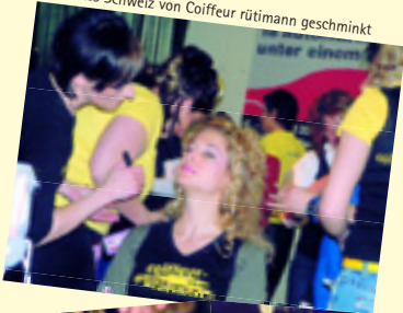
Miss Schweiz von Coiffeur rütimann geschminkt