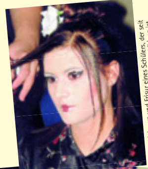
Make-up und Frisur eines Schülers, der seit 4 Monaten bei rütimann in Ausbildung ist

Anlässlich des Jubiläums 35 Jahre Coiffeur-Schule rütimann Olten/Willisau hat dieses Ausbildungszentrum einmal mehr ein internationales Frisieren durchgeführt, diesmal in der Stadthalle Olten, verbunden mit der Carexpo. Über 100 Coiffeure aus der ganzen Schweiz gingen an den Start, darunter auch sämtliche Coiffeur-Schüler der Coiffeur-Schulen Trendsetter und rütimann Olten/Willisau. Obwohl einige Schüler erst drei Monate in der Ausbildung sind, haben doch alle schon beachtliche Leistungen gezeigt und wurden im überfüllten Saal in der Stadthalle Olten mit Applaus begeistert aufgenommen. Unter den Models war auch die amtierende Miss Schweiz, Fiona Hefti, Bobteam Meyer, die Weltmeister der Schnauzträger und der Präsident der Bildungskommission des Kantons Solothurn, Klaus Fischer, der anschliessend in einer Rede dem «Coiffeur-Ausbildungszentrum rütimann» für seine Leistungen gratulierte und dankte. Herr Fischer wurde übrigens in der Zwischenzeit mit dem besten Resultat zum Regierungsrat gewählt.