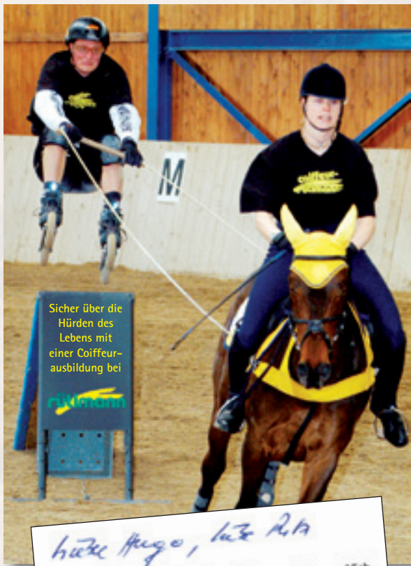
Sicher über die Hürden des Lebens mit einer Coiffeurausbildung bei

„Mit einer Ausbildung bei rütimann kommt man gut über die Hürden des Lebens.“