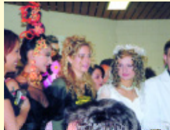
100 Frisurenkreationen von Schülern der Coiffeur-Schulen Trendsetter und rütimann Olten/Willisau