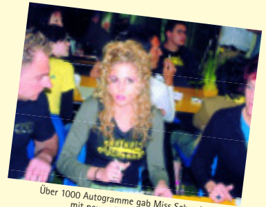
Über 1000 Autogramme gab Miss Schweiz mit neuer rütimann-Frisur