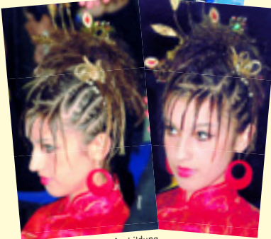
Seit 1 Jahr in Ausbildung bei rütimann

Wer sich übrigens für weitere Fotos der Haarkunst interessiert, was an diesem Tag von den Schülern gezeigt wurde, schaut in der Fotogalerie nach: www.coiffeur-ruetimann.ch