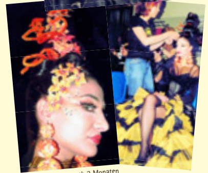
Schon nach 3 Monaten Ausbildung bei rütimann auf der Bühne