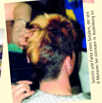
Schnitt und Farbe eines Schülers, der seit 8 Monaten bei rütimann in Ausbildung ist